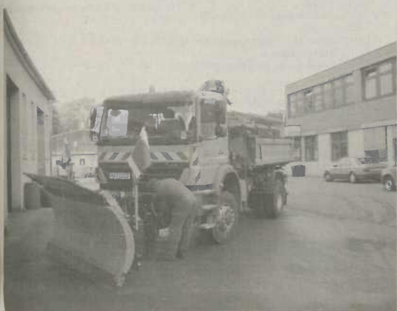
Funktionsprüfung eines Winterdienstfahrzeuges

ge, Treppen, Bushaltestellen und Fußwege im Einsatz sein. Beim Handräumdienst wird im Stadtgebiet Aalen Lavagranulat verwendet. Dieses relativ leichte Material führt beim Abschleppen in das Kanalnetz zu keinen Ablagerungen und kann auch in Grünflächen als Dünger verbleiben. Auf Fahrbahnen wird hauptsächlich Feuchtsalz ausgebracht. Im Auswurfteiler des Streuers wird trockenes Auftausalz mit einer 24prozentigen Salzlösung angefeuchtet. Dadurch wird das Taupotential des Streusalzes erhöht und eine bessere Haftung auf der Fahrbahn erreicht. Die Vorteile liegen bei einem geringeren Salzverbrauch, schnellerer Tauwirkung und einer besseren Haftung des Tausalzes auf der Fahrbahn. Daraus resultiert eine höhere Verkehrssicherheit und ein größerer Aktionsradius der eingesetzten Fahrzeuge.