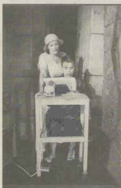
Das Theaterensemble "Berliner Compagnie".

Das Theaterensemble Berliner Compagnie wurde 1982 gegründet. Schauspieler und Schauspielerinnen aus verschiedenen Theatern wollten damals mit den Mitteln ihres Berufes etwas gegen die Stationierung der Cruise Missiles und Pershing Raketen tun. Inzwischen sind zu den Themen Frieden, Dritte Welt, Asyl, Armut und Menschenrechte 16 Produktionen entstanden.