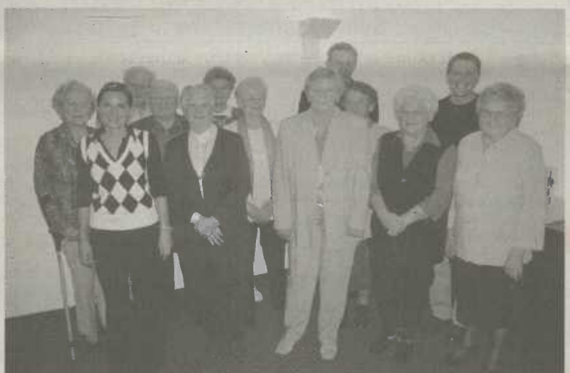
Sieben Mieter wurden für 40jährige und drei Mieter für 50jährige Treue zur Wohnungsbau Aalen GmbH geehrt.

tern Blumen, Wein und einen Geschenkkorb. Dabei betonte er, wie wichtig es für die Wohnungsbau sei, langjährige Mieter zu haben, die sich um das Objekt kümmern. "Sie schauen nach dem Rechten und sorgen sich auch um das Wohnumfeld". Die Wohnungsbau Aalen GmbH betreut zur Zeit im ganzen Stadtgebiet rund 1 600 Wohnungen. Erst kürzlich wurden 20 Wohnungen am Saumweg 1/3 von Oberbürgermeister Ulrich Pfeifle in seiner Funktion als Aufsichtsratsvorsitzender eingeweiht.