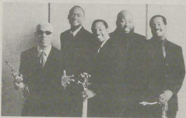
"Kool & The Gang"

Für die Konzerte im Künstlerhotel empfiehlt Festivalmacher Ingo Hug dringend eine rechtzeitige Reservierung. Hier gibt es an der Abendkasse kaum noch Tickets. Einzelkarten, Tageskarten und preisreduzierte Festivalpässe sind an den bekannten Vorverkaufsstellen erhältlich oder direkt bei kunterbunt e.V., Telefon: 07361/64158. Weitere Informationen im Internet: www.aalener-jazzfest.de .