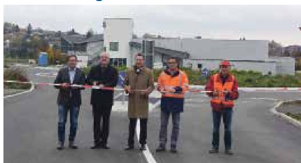
Der neue sechsarmige Kreisverkehr wurde freigegeben.