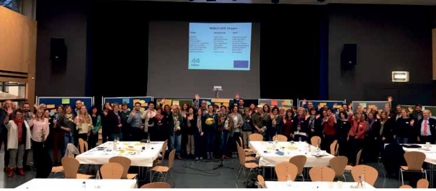
Großes Interesse fand das Fachforum im Weststadtzentrum.