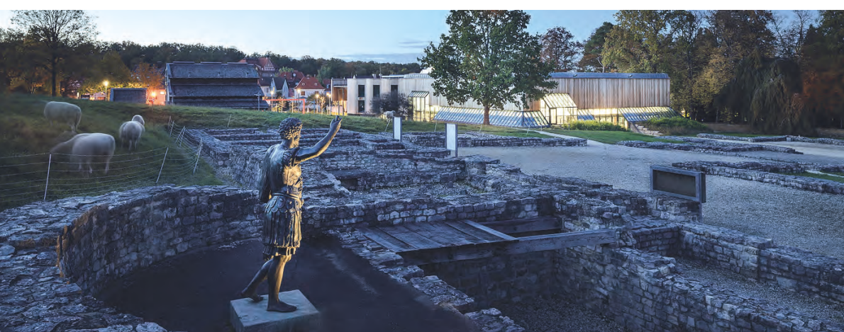
Eindrücke aus den vergangenen „Nachts im Museum“-Veranstaltungen im Limesmuseum und explorhino.