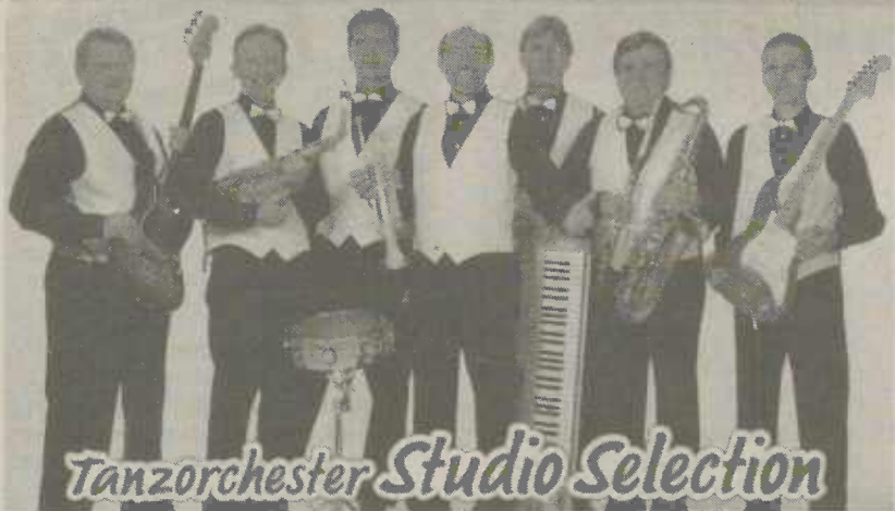
Tanzorchester Studio Selection

Amtsblatt der Stadt Aalen Herausgeber: Stadt Aalen - Presse- und Informationsamt - Marktplatz 30, 73430 Aalen, Telefon: (0 73 61) 52-11 30, Telefax: (0 73 61) 52 19 02. Verantwortlich für den Inhalt: Oberbürgermeister Ulrich Pfeifle und Pressereferent Günter Enslé. Druck: Süddeutscher Zeitungsdienst 73430 Aalen, Bahnhofstraße 65. Erscheint wöchentlich mittwochs.