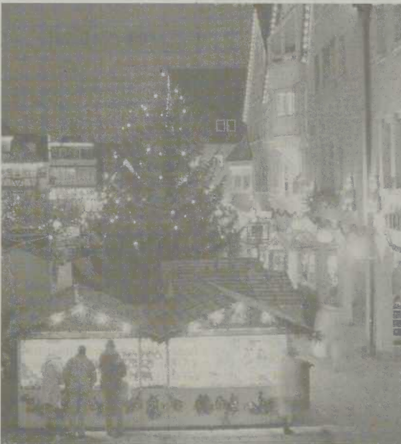
Pünktlich mit dem Start des Aalener Weihnachtsmarktes am morgigen Donnerstag können künftig unter www.aalen.de elektronische Grußkarten verschickt werden.

Im Aalener Frauennetzwerk sollen die bereits geplanten Aktivitäten zum Internationalen Frauentag am 8. März 2004 sowie zum Schwerpunktthema im Jahr 2004 "Migrantinnen" koordiniert werden.