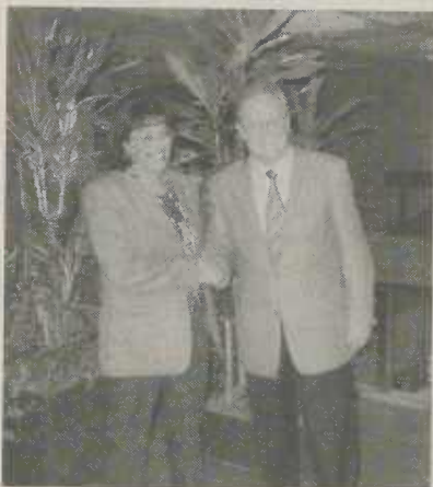
„Oberbürgermeisterin Iris Sentürk und Oberbürgermeister Ulrich Pfeifle“.

Die Oberbürgermeisterin der türkischen Partnerstadt Antakya verbrachte in der vergangenen Woche arbeitsintensive Tage bei ihrem Amtskollegen Ulrich Pfeifle in Aalen. Höhepunkt des Treffens war sicherlich der gemeinsame Besuch des Kongresses „50 Jahre Kommunale Selbstverwaltung in Baden-Württemberg – Motor für ein bürgernahes Europa“ in Karlsruhe sowie am Samstagabend der Bürgerball im Rathausfoyer.