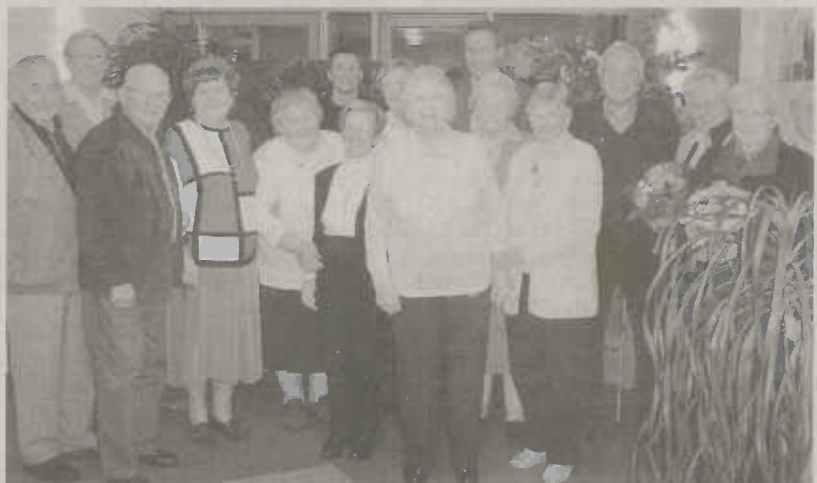
Sieben Mieter wurden für 50-jährige und sechs Mieter für 40-jährige Treue zur Wohnungsbau Aalen GmbH geehrt.

In einer kleinen Feierstunde in den Räumen der Wohnungsbau GmbH im Neuen Tor überreichte Ihl den langjährigen Mietern Blumen, Wein und einen Geschenkkorb. Dabei betonte er, wie wichtig es für die Wohnungsbau sei, langjährige Mieter zu haben, die sich um das Objekt kümmern. "Sie schauen nach dem Rechten und sorgen sich auch um das Wohnumfeld." Gleichzeitig informierte Ihl die Jubilare über das groß angelegte Instandsetzungsetzungs- und Modernisierungsprogramm für den Bestand. Dabei stünden energetische Maßnahmen im Vordergrund. "Durch die Qualitätsverbesserung der Häuser und Wohnungen möchten wir unsere Mieter auch weiterhin an uns binden."