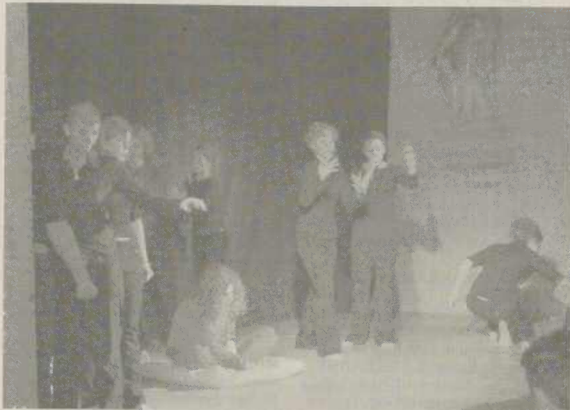
"Jugendspielclub des Theaters der Stadt".

Ein Tag von Jugendlichen, für Jugendliche. Unter diesem Motto stand die diesjährige Feierlichkeit der Stadt Aalen zum Tag des Ehrenamtes am vergangenen Samstag. Oberbürgermeister Ulrich Pfeifle lud besonders engagierte Jugendliche und Jugendleiter aus den Vereinen, Schulen, Kirchen und anderen Organisationen sowie der freien Jugendarbeit ins Rathausfoyer ein, um deren Engagement zum Wohl der Allgemeinheit zu würdigen und ihnen Dank zu sagen.