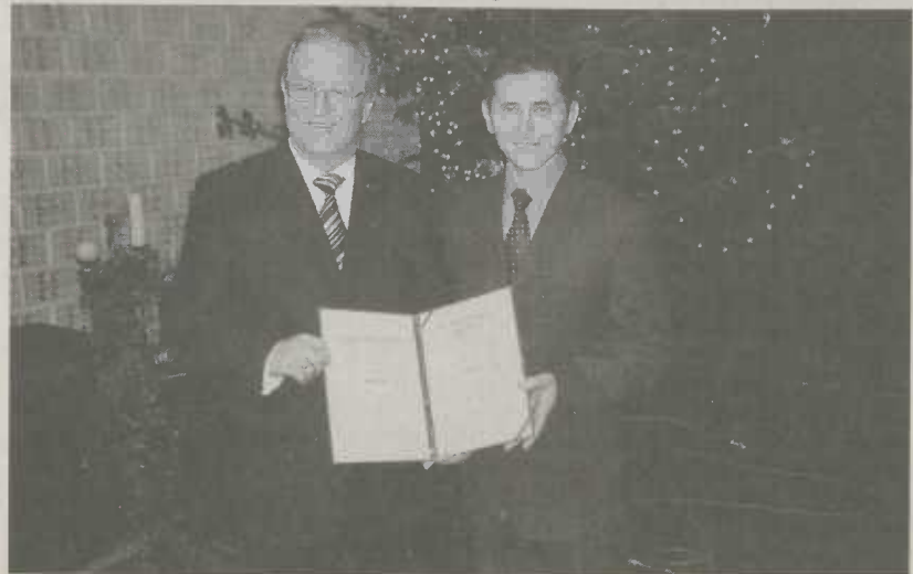
Oberbürgermeister Ulrich Pfeifle und Oberbürgermeister Janos Bencsik

Im Rahmen einer feierlichen Gemeinderatssitzung am vergangenen Samstagabend im Kulturhaus von Tatabánya wurde Aalens Oberbürgermeister Ulrich Pfeifle von seinem Amtskollegen aus der ungarischen Partnerstadt Janos Bencsik die Ehrenbürgerwürde verliehen. Oberbürgermeister Pfeifle ist der erste Ausländer, dem diese Ehre zuteil wurde.