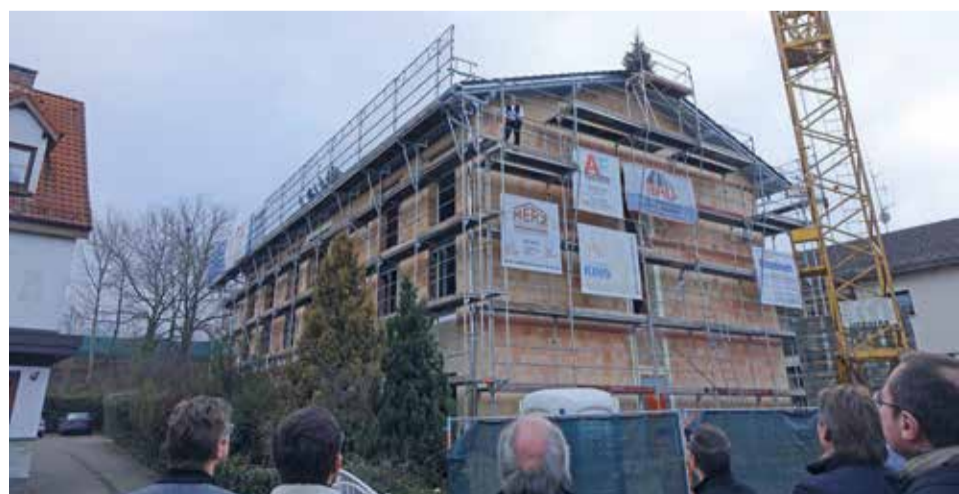
Hotel „Wilder Mann“ feiert Richtfest.