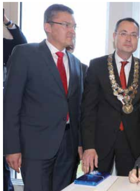
Bundeskanzlerin Angela Merkel trägt sich ins Goldene Buch ein.