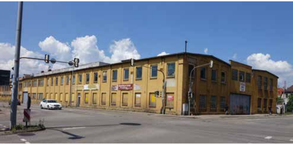
Das Ostertaggebäude wurde von Living Immoations erworben.