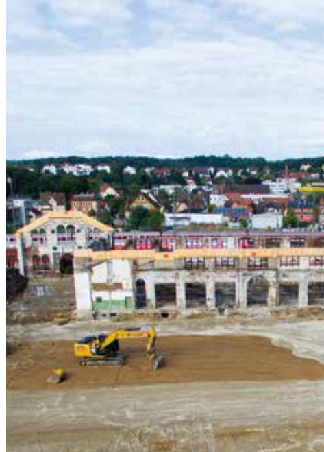
Der Kulturbahnhof wird im ehemaligen Bahnausbesserungswerk gebaut.

Eröffnung des neuen Bouldromes auf der ehemaligen Minigolfanlage in Unterkochen. Mit der finanziellen Unterstützung der Stadt Aalen ertüchtigte der Petanque Club Aalen die Anlage.