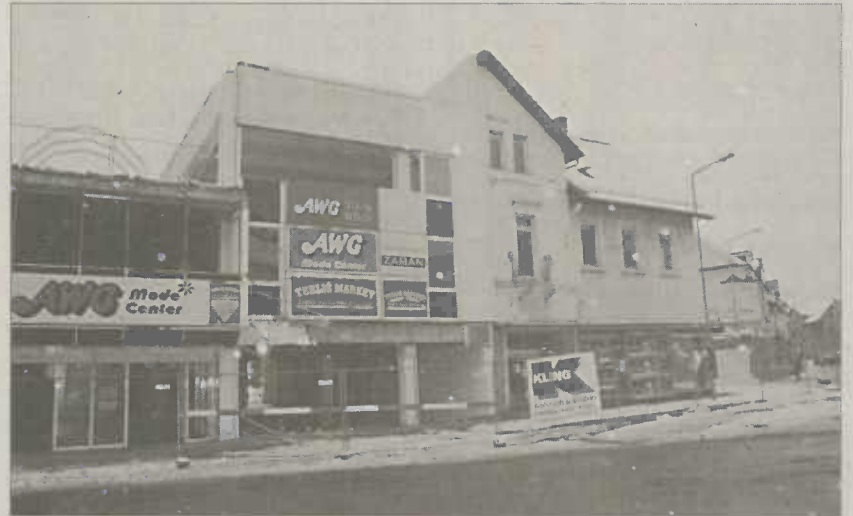
Die letzten Tage sind gezählt

Am Donnerstag, 26. Februar 2009 ist die Geschäftsstelle geschlossen.